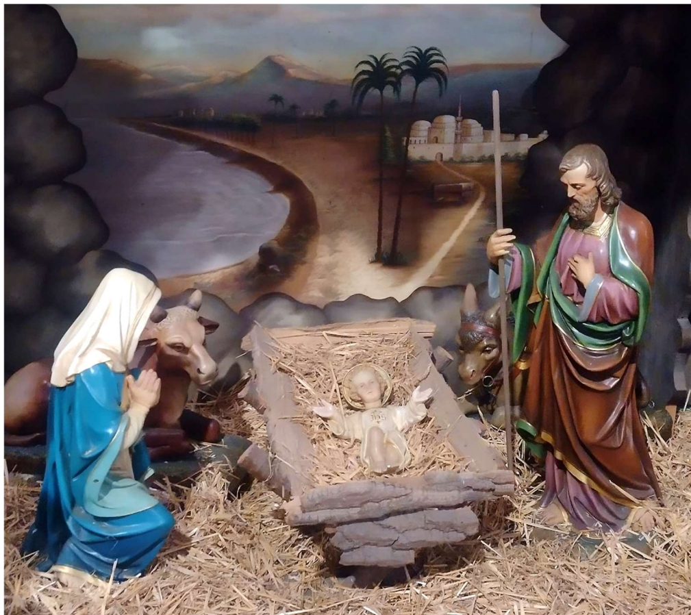
Kerststal H. Hartkerk Overhoven.

Wij wensen u allen van harte Zalig Kerstfeest en een Gezegend 2025